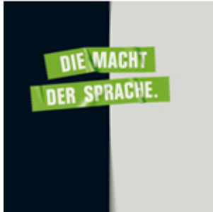
Die Macht der Sprache

und Ungarn. Die Künstler erforschen auf gemeinsamen Reisen ihre Erinnerungen und beschreiben bzw. fotografieren die Reminiszenzen des jeweils anderen. Dieses Projekt findet im Rahmen von Bipolar deutsch-ungarische Kulturprojekte statt. Bipolar ist ein Initiativprojekt der Kulturstiftung des Bundes. Initiativprojekt der edition 8 in Kooperation mit dem ungarischen Partner Europäische Kulturstiftung Budapest